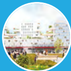
Cœur Université Nanterre