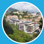
Cap Azur Roquebrune-Cap-Martin