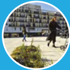
Fort d'Issy Issy-les-Moulineaux